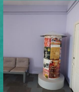
Образовательная зона «Театр «Калейдоскоп»